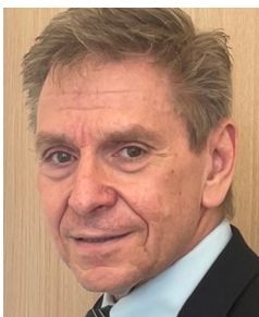
MinDirig Stefan Sohm Ministerialdirigent, Compliance Beauftragter im Bundesministerium der Verteidigung (BMVg)